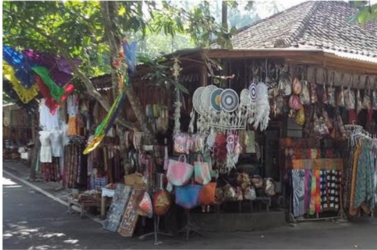
Gambar 2 Kios cendera mata milik warga setempat di sekitar lokasi Pura Tirta Empul.

“Setiap hari Pura Tirta Empul selalu dikunjungi wisatawan, baik wisatawan lokal, domestik, atau mancanegara. Pura Tirta Empul yang kami banggakan ini mampu menarik turis untuk datang ke sini sehingga kesejahteraan sosial-ekonomi krama di sini berkembang, dana yang kami peroleh – melalui jasa parkir kendaraan dan donasi yang diberikan oleh pengunjung (turis) dapat digunakan untuk memelihara bangunan Pura Tirta Empul ini (Putu Sujana, 57 tahun).”