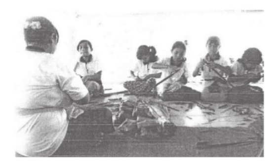
Gambar 2 Peseta pasraman putri: berlatih mejejahitan

Sejauh ini belum ada evaluasi dampak pasraman terhadap kepribadian remaja peserta pasraman sehingga belum diketahui secara pasti tentang manfaat penyelenggaraan pasraman. Untuk mengetahui keberhasilan proses pasraman semestinya disiapkan modul yang terstandar (terakreditasi) sehinga penyelenggaraan pasraman benar-benar bisa diakui kualitasnya. Selain itu, pre dan post test diperlukan untuk mengetahui kemanfaatan dari penyelenggaraan pasraman.