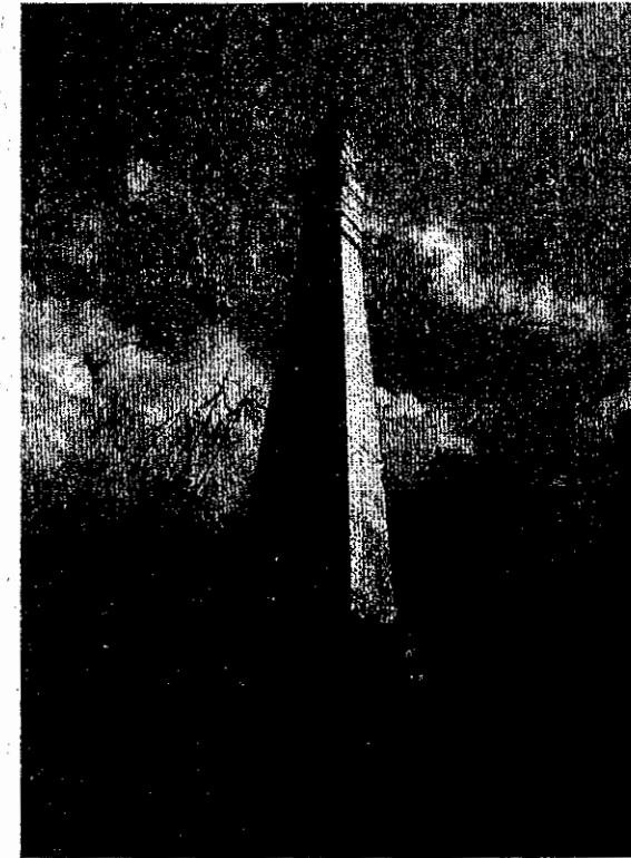
Gambar 1.1 Monumen bersejarah di Dusun Gunungsari Cempaga

Namun, kondisi monumen itu sekarang cukup memprihatinkan sebab beberapa keramik pembungkus monumen sudah mulai mengelupas, dan semak belukar tumbuh liar di sekitarnya. Sementara itu di sisi barat monumen kini telah berdiri sebuah villa yang jaraknya tidak lebih dari 5 meter dari monumen dimaksud.