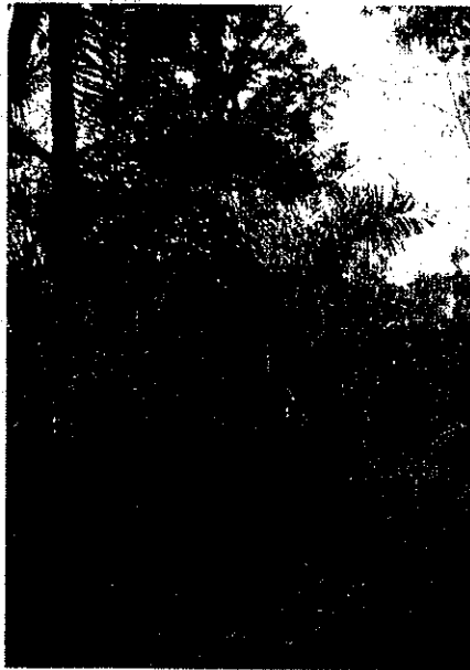
Gambar 1.2 Tanaman enau yang diambil niranya untuk membuat gula aren

Gula aren adalah sejenis gula merah yang diperoleh dengan cara merebus tuak pohon enau (air sadapan pohon enau) dalam waktu kurang lebih lima jam kemudian dituang ke dalam cetakan yang telah disediakan. Populasi tanaman enau ini sekarang sudah mulai berkurang, karena para petani telah mengganti jenis tanaman ini dengan tanaman cengkeh. Secara ekonomis hasil bertanam cengkeh lebih menjanjikan dari pada pohon aren. Bila memandang daerah sekitar Desa Cempaga dari ketinggian maka yang tampak adalah hamparan pohon cengkeh. Tanaman ini mulai ditanam di Desa Cempaga sekitar tahun 1976.