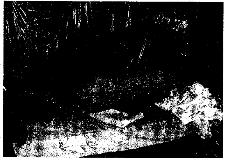
Gambar 1.5 Ruang Tidur Bale Saka Roras