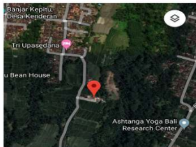
Gambar 4.1 Lokasi Pembangunan Proyek Kendran Village Resort

Total nilai Proyek Pembangunan Gedung SMA Negeri 2 Abiansemal ini berjumlah Rp. 56.413.091.306.,98 ( Lima Puluh Enam Miliar Empat Ratus Tiga Belas Juta Sembilan Puluh Satu Ribu Tiga Ratus Enam Koma Sembilan Puluh Delapan ). Proyek Pembangunan Gedung SMA Negeri 2 Abiansemal ini dimulai dari bulan mei tahun 2019 sampai dengan bulan November 2019. Proyek Pembanguan Gedung SMA Negeri 2 Abiansemal di garap oleh PT. Sanur Jaya Utama dan memiliki struktur organisasi yang lengkap, dari tahap pelaksanaan dimanajemen dengan baik.