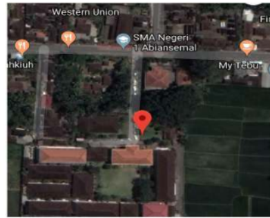
Gambar 4.2 Lokasi Proyek Pembangunan Gedung SMA Negeri 2 Abiansemal