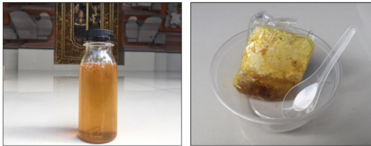
Gambar 1. Produk Madu UMKM YBS Sebelum Branding

Selama ini UMKM YBS menjual produknya tanpa disertai brand , sehingga belum terdeferensiasi dengan produk lain yang sejenis (Gambar 1), padahal branding merupakan salah satu kunci keberhasilan menjalankan UMKM. Brand (cap) merupakan konsep pemasaran (marketing) yang terdiri dari tanda atau cap dan asosiasi konsumen pada cap tersebut (Permata et al., 2019).