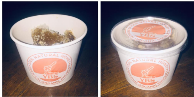
Gambar 4. Penggunaan Brand pada Packaging Produk Madu UMKM YBS