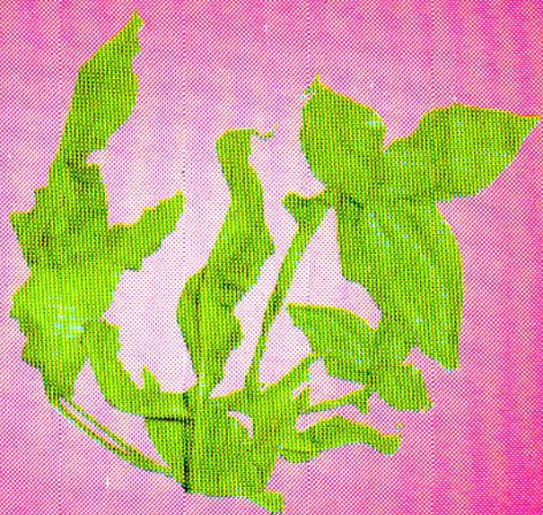
Daun Bilwa ( Ficus religiosa L.)