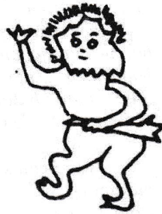
Banaspatiraja matemahan Dorakala.