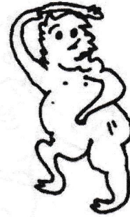
Marajapati matemahan Yoga Manik.